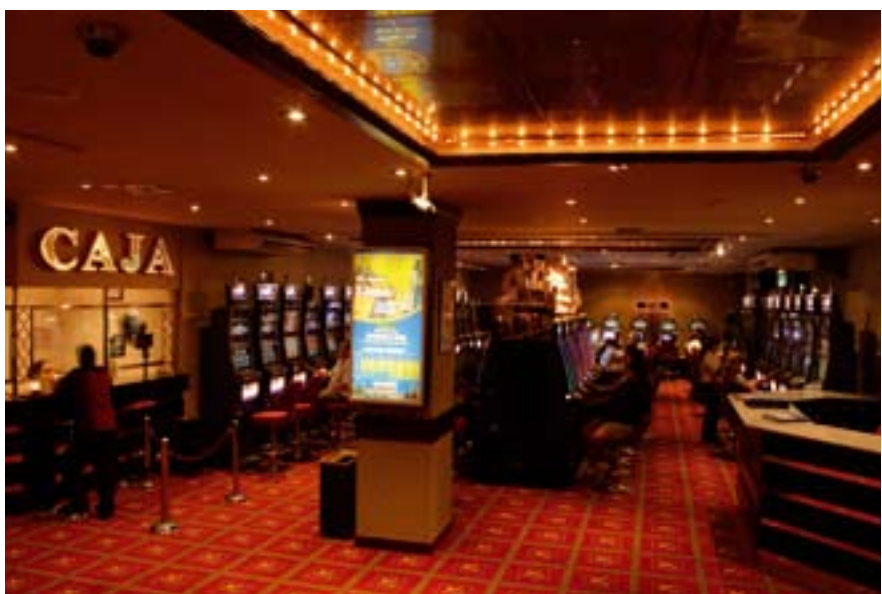
Admiral Carrera Casino.

Another issue of the strategy of the Admiral Group in the year 2008 was centered on investments to improve the current locations; carrying out remodeling activities. In 2009 the main focus is on the evaluation of new locations for the development of large scale projects (500 slots and more) and the creation of a new flagship operation that will once more mark the leading position of the