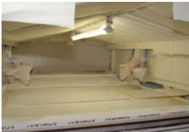
The modern paint-spray line, fully automated.

Fräs- und Bohrmaschine sowie einer umweltfreundlichen Lackierstrasse, die der ganze Stolz von Tischlerei-Leiter und Chefdesigner Christian Bauer ist: „Diese neue 600.000-Euro-Lackierstraße ist eine vollautomatisierte Industriemaschine, die uns den Umstieg von manuellen und lösungsmittelbasierten Lackierarbeiten auf eine vollautomatisierte, wasserbasierte Lackieranlage ermöglicht hat. Sie bietet nicht nur wirtschaftliche Vorteile, wie reduzierten Personalaufwand durch die Automatisierung, sondern auch wesentliche Vorteile in Bezug auf Arbeitsschutz und Umweltschutz.“ Die neue Lackierstrasse ermöglicht eine 30-prozentige Lackrückgewinnung. Reduktion des jährlichen Lackbedarfs von 29 Tonnen auf nunmehr 22,5 Tonnen und ist damit ein wichtiger Erfolgsfaktor für die neue umweltfreundliche Novomatic-Tischlerei. b