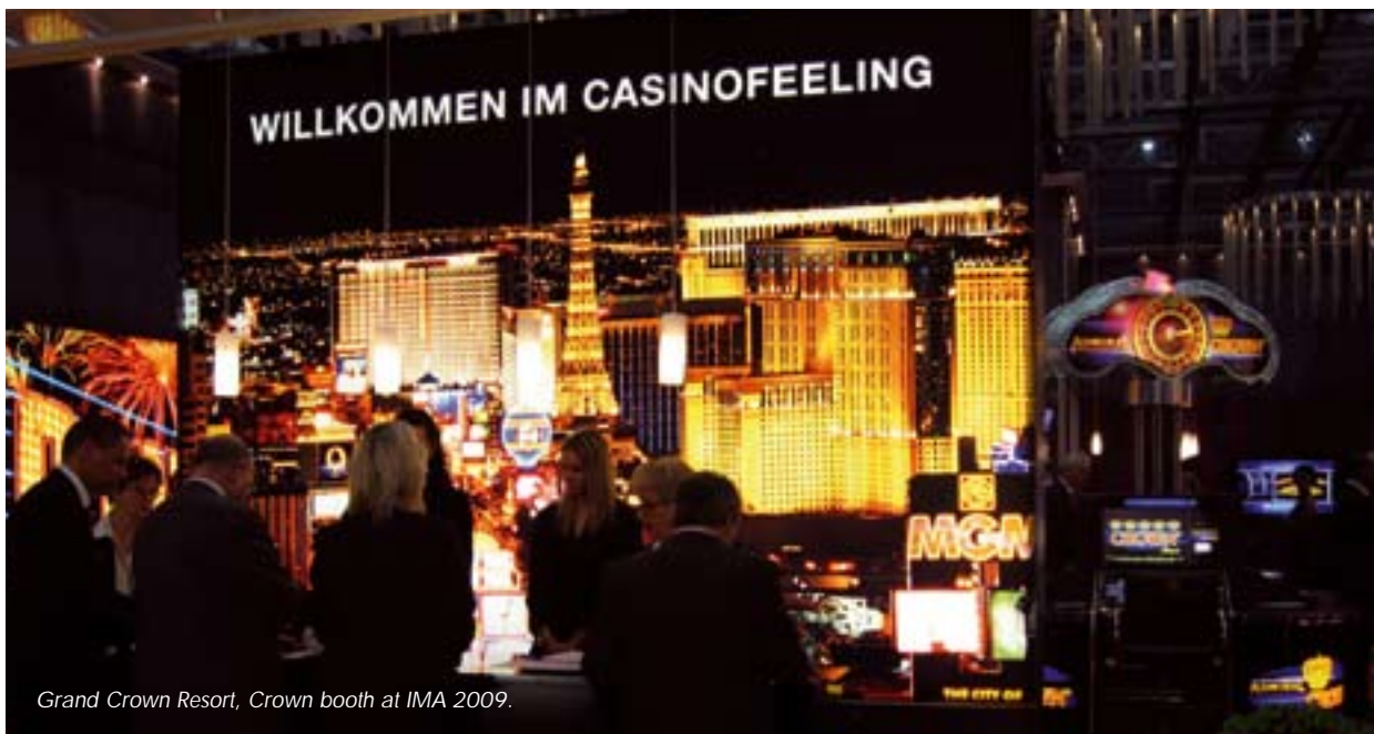
Grand Crown Resort, Crown booth at IMA 2009.