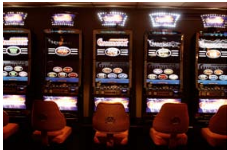
Top: Admiral Morelli Casino, below: Admiral Aviación Casino.