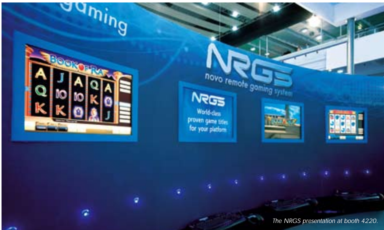
The NRG3 presentation at booth 4220.