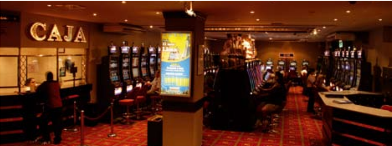
Admiral Carrera Casino.

läufen im Spielbetrieb, Promotionaktionen und Kundenbedürfnissen bestens vertraut sind Einrichtungen.