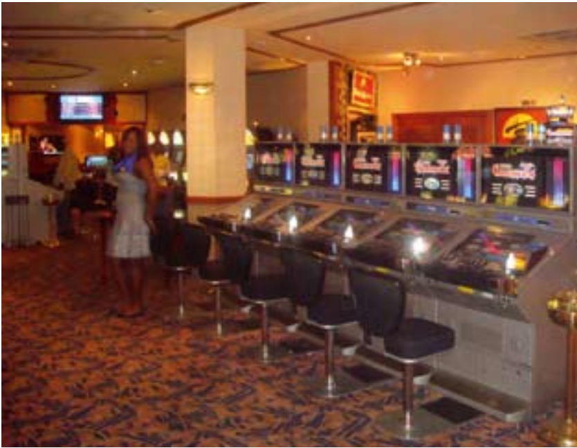
KaiRo International's La Palm Casino.