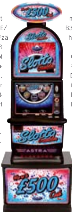
Slotto Gambler, Category B3.

Die gebündelten Energien des Astra-Entwicklungsteams brachten zahlreiche video- und walzenbasierte Category C-Spiele hervor: der faszinierende Publikum mit frischem Design und benutzerfreundlicher Spielunterhaltung. Auch die Category für Holland; Games Palace, Once Upon a Time und das Multi-Game Action Pack für Belgien sowie eine walzenbasierten Konzepten für Spanien und Italien.