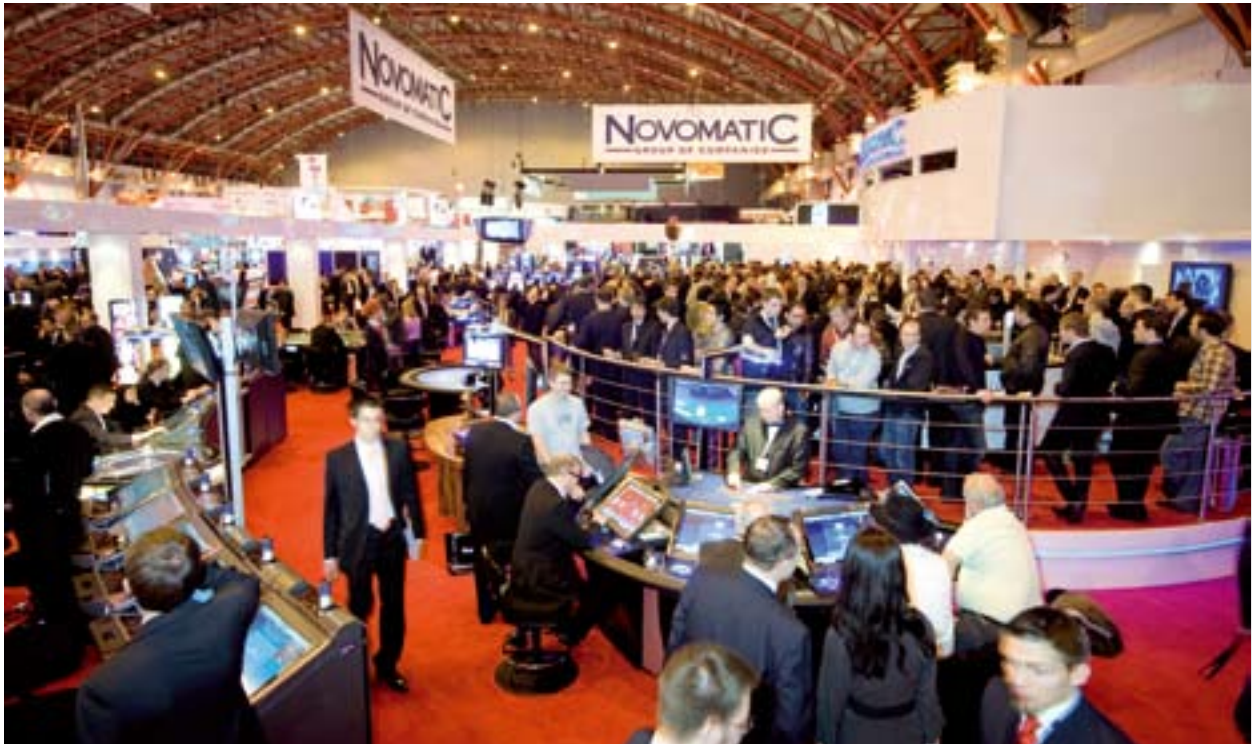
Novomatic booth, ICE 2009.