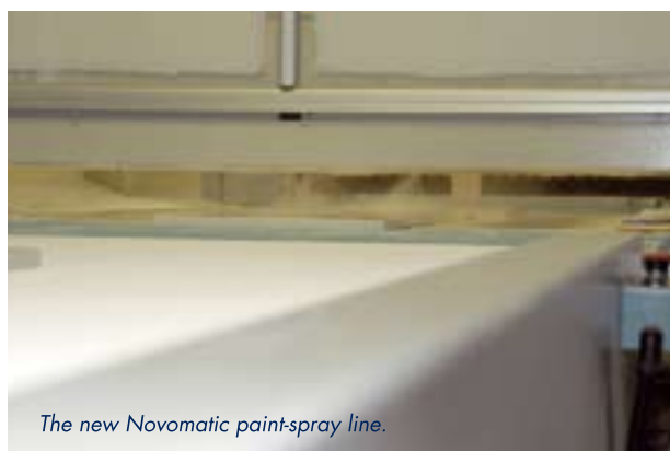
The new Novomatic paint-spray line.

The new paint-spray line allows for a 30 percent lacquer recycling – an annual 6.7 tons of varnish, given the annual processing of 22.5 tons. It has thus helped the company reduce the annual varnish usage from 29 tons to 22.5 tons and set the standard for the new, economically friendly, Novomatic carpentry. b