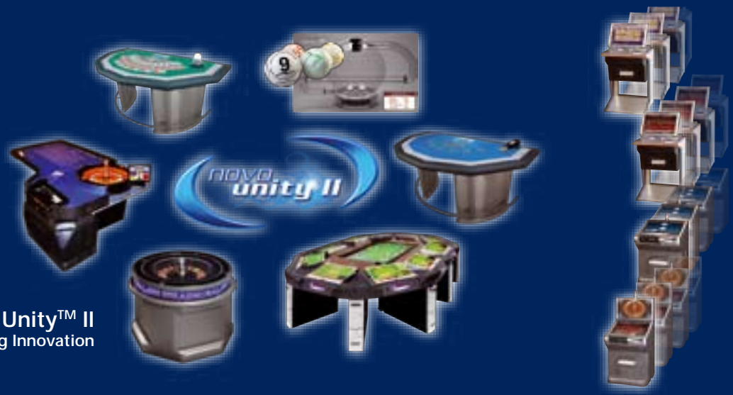
Novo Unity™ II The Ultimate Gaming Innovation

O O' z a Novo TouchBet® Live-Roulette ra Novo Multi-Roulette™ aO2 q Novo Flying Roulette™ a' O' a1%a a1i Ua Novo Unity™ Ilra - i e " O- z a' z e gabl2 aO2 qa' Oe a1i Ua' Ooz U' aez a' h z q11- a1i a' o111' Ua a- 11i e aea' Oeab2 aO2 qa -gce- z2 a12 qa' Oe a1i a - 11o' e " a' h1- aez U' a' o11i Ua a' z OaE