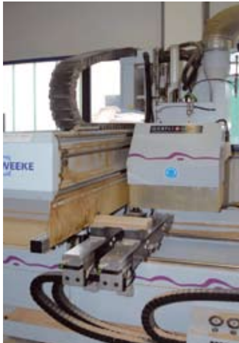
Top: the new warehouse, below: the automated milling and boring machine.

meter. Dies entspricht einer Fläche von vier Fußballfeldern.