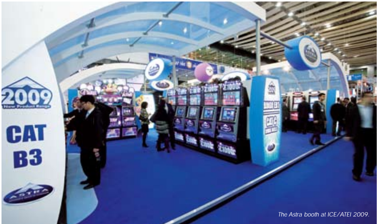
The Astra booth at ICE/ATEI 2009.