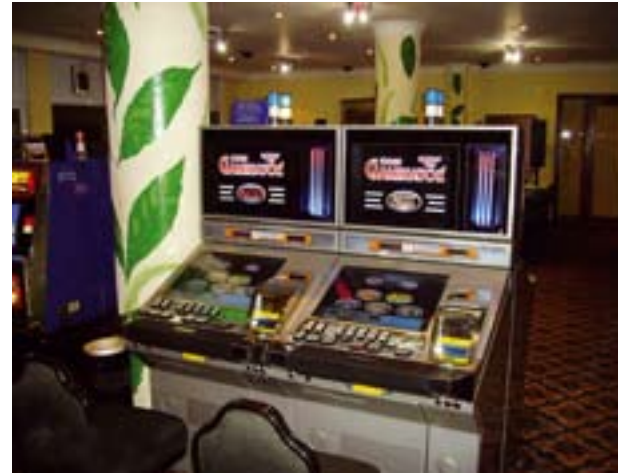
Novomatic gaming equipment in KaiRo International operations, top: Casino Safari and below: New Africa Casino.

O Oc-¶ã² zú Oca¶² O¶ã OÜã Ygoz ¶² ä ¶- zÚã qOYã i YãS² " zYgoz ¶ã%Úã 1 ¶¶i- Cã¶ã; Ú¶qi " zã ¶ã %¶gOÜãzÚ SÚã-¶¶ãã% ¶Y zãã-OzYã i² qã Marketing Manager von AGI Africa. „Da unsere Geräte in allen - Oc-¶¶i/ zãz] z² äqzÚãz Ú¶¶i ¶z gãã¶ ¶ããõ] z² äYgãã O i gããO² qz Úã ä afrikanische Betreiber entschieden, Novomatic-Equipment zu kaufen. Seit der Unternehmensgründung konnten wir auf diese Weise unsere Aktivitäten auf den gesamten afrikanischen Kontinent ausdehnen. Wir sind überzeugt, dass diese Expansion sich auch in der Zukunft fortsetzen wird, basierend auf ausgezeichneten Produkten und hervorragendem Kundenservice." b