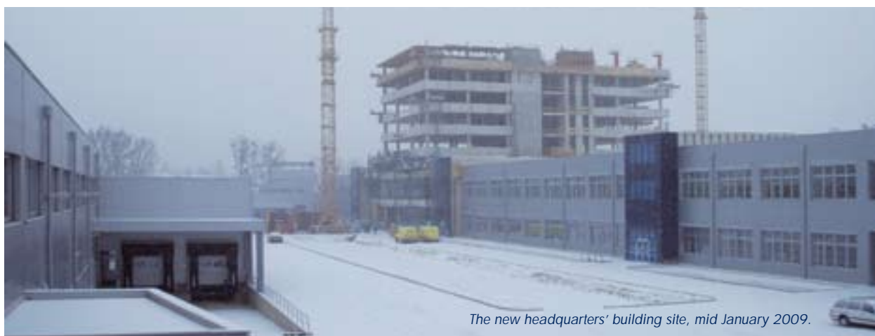
The new headquarters' building site, mid January 2009.

Fräs- und Bohrmaschine sowie einer umweltfreundlichen Lackierstrasse, die der ganze Stolz von Tischlerei-Leiter und Chefdesigner Christian Bauer ist: „Diese neue 600.000-Euro-Lackierstraße ist eine vollautomatisierte Industriemaschine, die uns den Umstieg von manuellen und lösungsmittelbasierten Lackierarbeiten auf eine vollautomatisierte, wasserbasierte Lackieranlage ermöglicht hat. Sie bietet nicht nur wirtschaftliche Vorteile, wie reduzierten Personalaufwand durch die Automatisierung, sondern auch wesentliche Vorteile in Bezug auf Arbeitsschutz und Umweltschutz.“ Die neue Lackierstrasse ermöglicht eine 30-prozentige Lackrückgewinnung. Reduktion des jährlichen Lackbedarfs von 29 Tonnen auf nunmehr 22,5 Tonnen und ist damit ein wichtiger Erfolgsfaktor für die neue umweltfreundliche Novomatic-Tischlerei. b