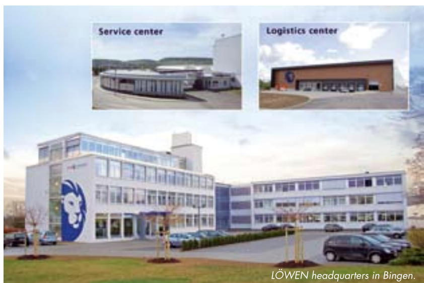
LÖWEN headquarters in Bingen.

die tägliche Happy Hour ab 17 Uhr lädt zu einem entspannenden Drink vor Messeschluss ein. Übrigens veranstaltet LÖWEN wieder eine seiner legendären Standpartys. Gleich am ersten Messeabend heizen die Darsteller des britischen Queen-Musicals „We will rock you“ den ausschließlich persönlich geladenen Gästen ein. An den täglichen Verlosungen hingegen dürfen alle Standbesucher teilnehmen, die einen entsprechenden Teilnahme-kupon ausgefüllt haben. Dieses Jahr locken als Hauptgewinne attraktive Reisen. b