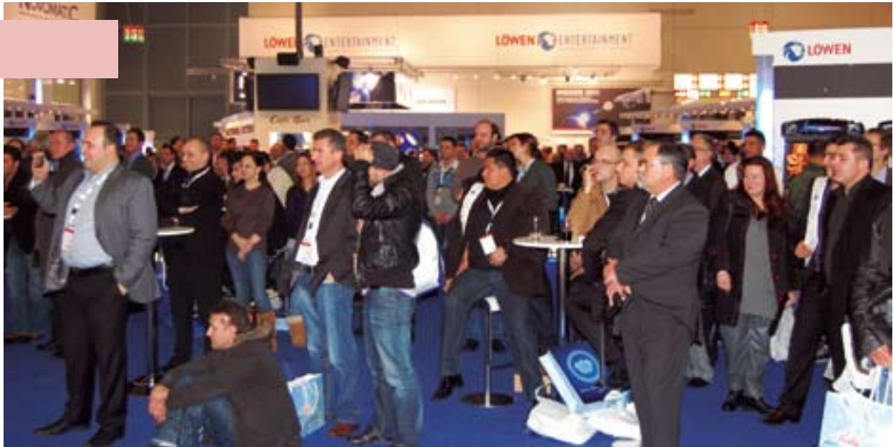
Entertainment at the LÖWEN booth at IMA 2011.