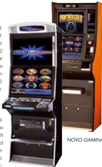
NOVO GAMINATOR III and PANTHER GOLD.

Auf dem LÖWEN Stand wird nicht zuletzt viel unterhaltsame Action geboten. Das Catering hat sich über die letzten Jahre einen hervorragenden Ruf erworben, und