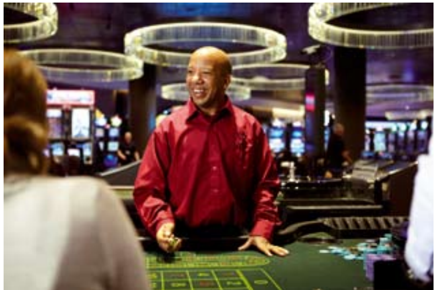
Aspers Casino Westfield Stratford City.