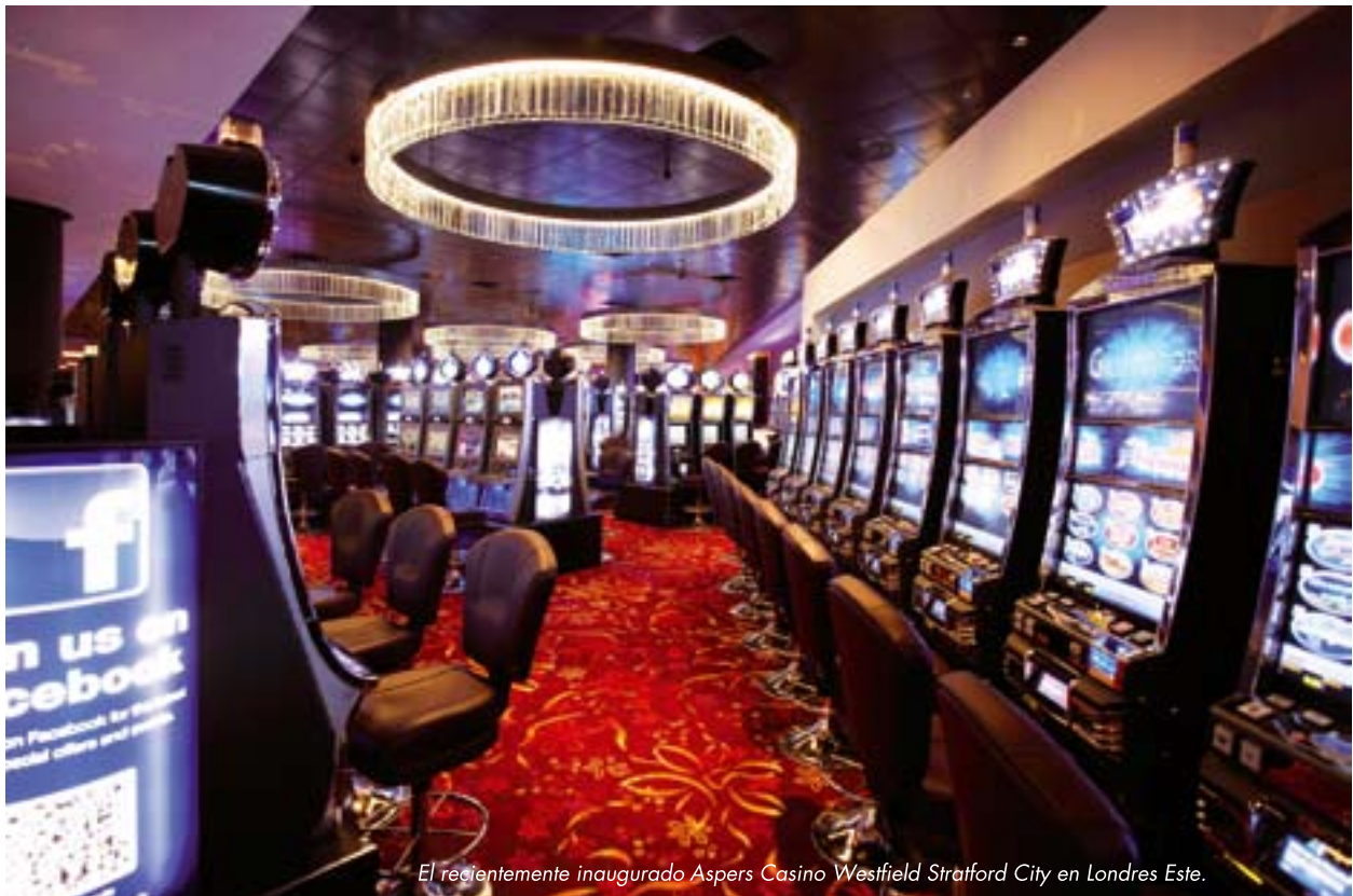
El recientemente inaugurado Aspers Casino Westfield Stratford City en Londres Este.