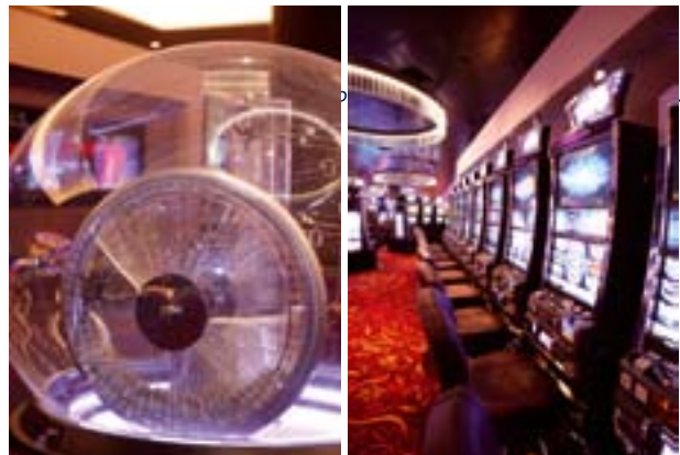
El recientemente inaugurado Aspers Casino Westfield Stratford City en Londres Este.

Al hablar en una recepción realizada en la tarde de la apertura del lugar, Jens Halle, Director General de Austrian Gaming Industries, dijo: "Todas las personas involucradas con el Aspers Casino Westfield Stratford City merecen ser felicitadas por lo que hoy es el casino más grande del Reino Unido. Los cambios en la legislación del Reino Unido significaron el equilibrio adecuado entre una regulación firme pero justa, abriendo la posibilidad – ahora una realidad – de crear lugares de juego más grandes que ofrezcan un entretenimiento de primer nivel como el que vemos aquí en el Aspers Casino Westfield Stratford City en Londres". b