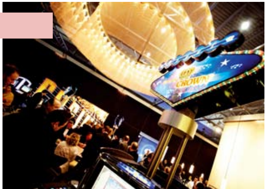
Auténtica atmósfera de casino: el stand Crown en la IMA 2011.

Las carreras del Grand Prix en Montecarlo y Monza, más la carrera de resistencia Le Mans 24 Horas son la 'liga real' de los legendarios eventos automovilísticos. Junto con el slogan 'Experimentando Leyendas', Crown Technologies se presenta en la IMA 2012 de Düsseldorf una vez más como partner de todos los operadores AWP que aspiran a ofrecer algo fuera de lo normal a sus visitantes. Con numerosos agregados y novedades la Royal Admiral Crown Slant será nuevamente el centro de atención en el stand de la feria en la sala 8. Brillantes aplicaciones cromadas, atractivos marcos luminosos LED y materiales de primera calidad hacen que el buque insignia de Crown sea una atracción excepcional. Su combinación única de juegos estará optimizada una vez más en el 2012 para garantizar una experiencia de juego de clase superior.