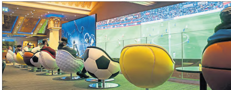
Live-Übertragungen von Sportevents in der neuen Admiral Arena Prater.

Im Zentrum steht - wie in einer American Sportsbar üblich - eine große, halbrunde Bar mit einer 15 m 2 LED Wall in 4K Full HD Qualität. Eine weitere LED Wall, mit 45 m 2 auch die größte Indoor LED Wall Europas, zielt die Längsseite der Arena. Die Hauptwand hat mit einer Länge von rund 15 m sowie einer Höhe von rund 3 m die Größe einer kleinen Wohnung und ein Gewicht von circa zwei Tonnen. Die Wall besteht aus 192 einzelnen Paneelen mit insgesamt 4.915.200 LED Bildpunkten. Zum Betrieb der beiden LED Walls wurden rund sechs km Kabel verlegt. Auf diesen gigantischen Walls erleben die Gäste Sportübertragungen