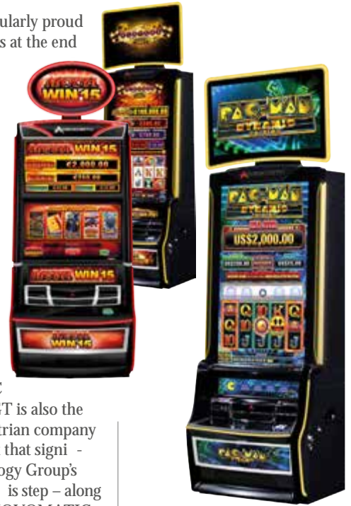
Línea de gabinetes AGT: A600® y A640®.

Neumann comments: “In the course of this registration all compliance aspects were thoroughly audited – including all parts of NOVOMATIC AG.” The majority acquisition of AGT is also the largest investment to date of an Austrian company in Australia. And it is an investment that significantly increases the gaming technology Group’s stake in the global gaming market. This step – along with others – is intended to make NOVOMATIC the global market leader in the field of high-tech gaming technology in the long-term.